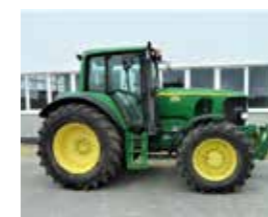
John Deere - 6920 S Auto-Powr , 2006, 169/125 PS/kW, 6185h, K, A, KL, gFVA, FZW, FH, DLB, EUR 55.000,- inkl. 20% MwSt., +43 676 88086781